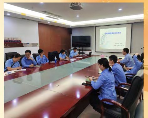
3月18日，肇庆理士组织“化验室相关安全知识”的培训。（通讯员 杨春雷）