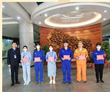
3月31日，肇庆理士举行3月份员工爱心基金颁发仪式。（通讯员 肖汝婷）