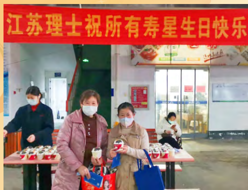
3月24日，江苏理士举办2—3月员工生日活动（通讯员 张荣雨）