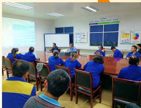
3月30日，肇庆理士仓储部开展SAP系统操作知识培训。（通讯员 江书华）